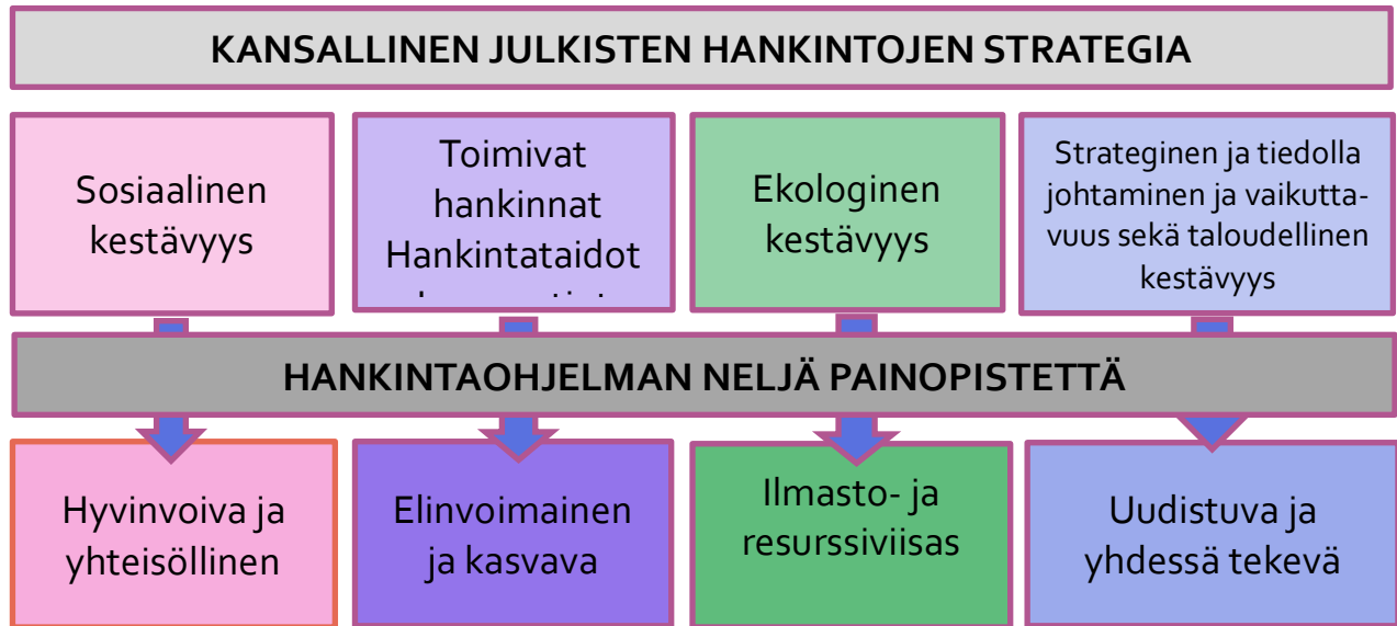
Kuvio 5. Kansallinen julkisten hankintojen strategia