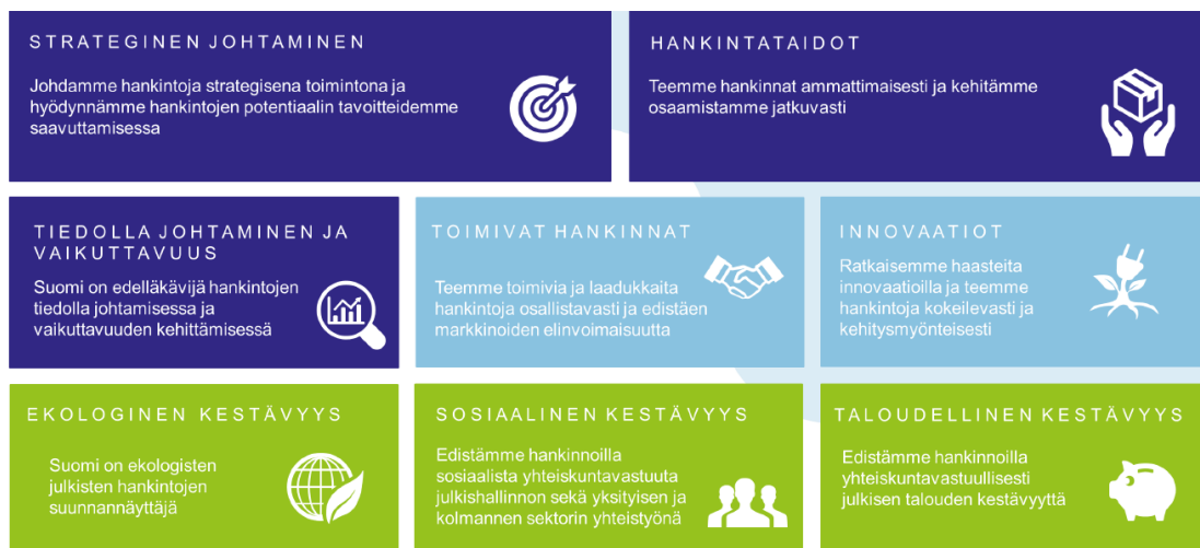
Kuvio 4. Kansallisen hankintastrategian tahtotilat

Kuopion kaupunkistrategia vuoteen 2030 kertoo kaupungin halutun tulevaisuuden kuvan ja päämäärät ja toimii johtamisen välineenä sekä ohjaa pitkäjänteistä toiminnan suunnittelua. Strategia on koko kaupunkiyhteisön yhteinen ja se ohjaa myös konserniyhteisöjen talous- ja toimintasuunnitelmia. Hankintaohjelma on yksi kaupunkistrategiaa toteuttavista ohjelmista, jonka tavoitteita ohjaa myös kansallinen julkisten hankintojen strategia.