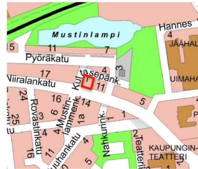
Kuva 1. Kaavamuutosalue on merkitty punaisella viivalla