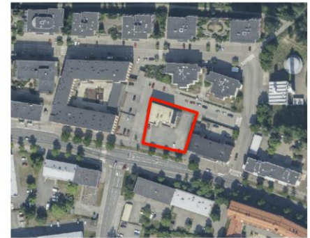
Kuva 2. Ilmakuva alueesta kaavamuutosalue on merkitty punaisella viivalla